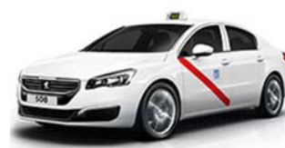
Los taxis en Madrid son blancos con una banda lateral roja

Puede encontrar toda la información sobre taxis aquí