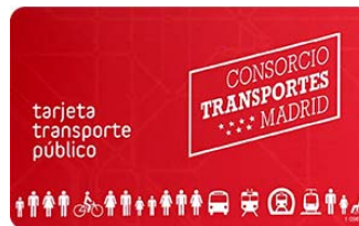
Imagen Tarjeta Multi